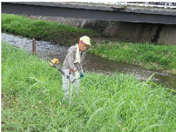
写真④：草刈中2 土手の斜面