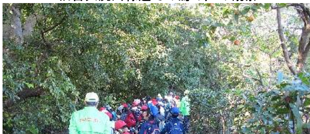
写真⑤：1班（その2） 旧目久尻川緑道での鳥の声の観察