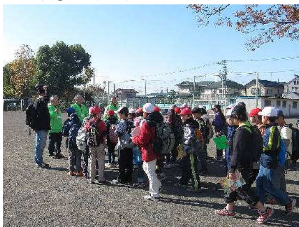
写真④：1班（その1）いざ出発