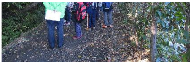
写真⑦：2班（その1）いざ出発