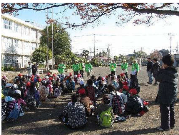
写真③：エコネットメンバー挨拶（2）