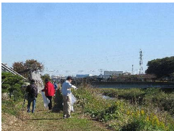
写真③：目久尻川（3）上合橋付近