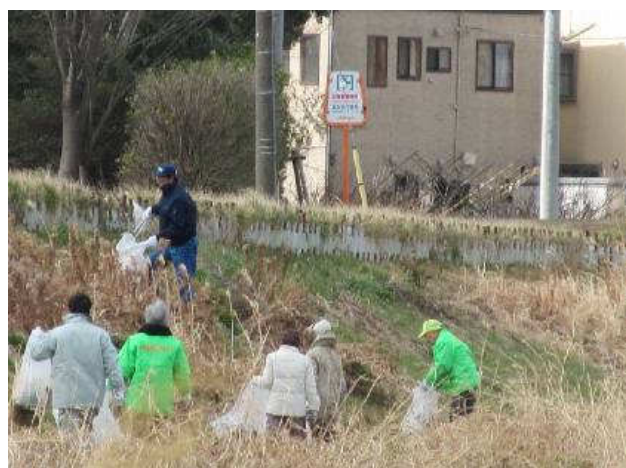
写真④：ゴミ拾い中3 上合橋下流左岸