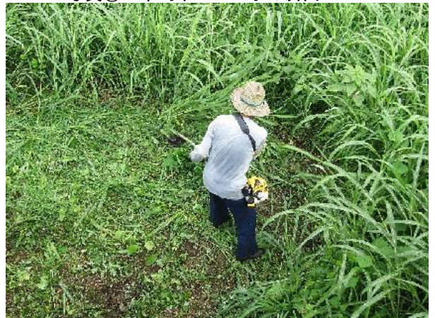
写真⑤：草刈中3 土手の斜面