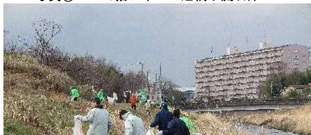
写真⑤：ゴミ拾い中4 旭橋下流右岸