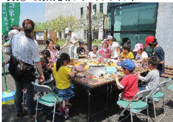
写真⑤：間伐材を切ってペインティング