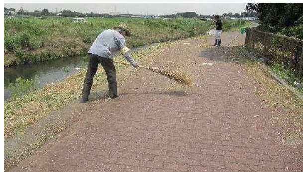
写真⑨：草刈り後 久保田橋から下流