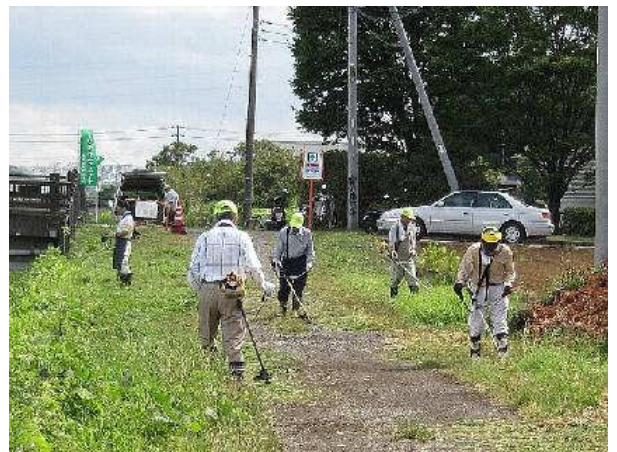
写真③：草刈中1 上合橋下流左岸