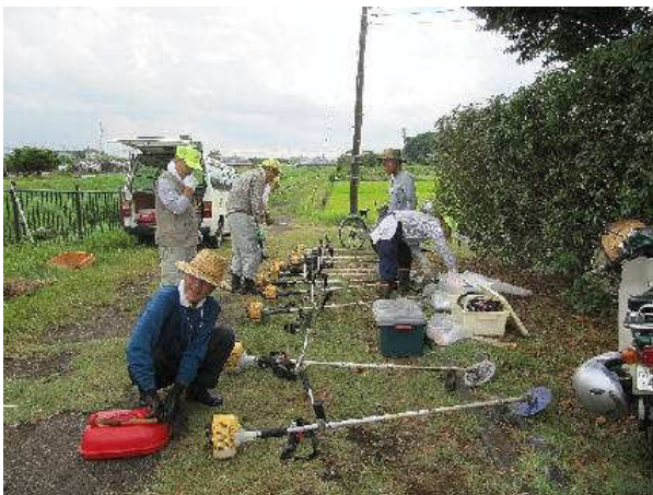
写真②：草刈準備中 上合橋