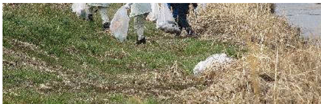
写真⑦：ゴミ拾い中 旭橋下流右岸