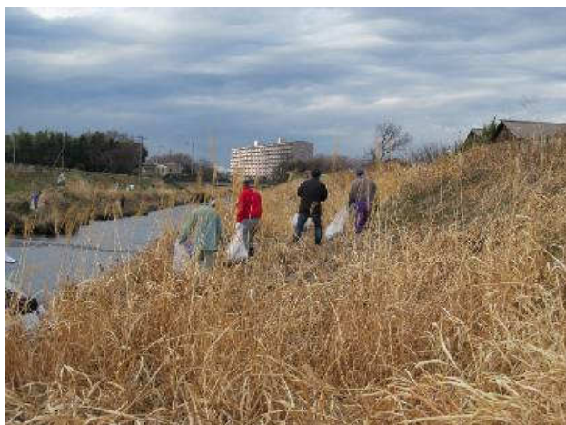
写真③：ゴミ拾い中2 旭橋下流右岸