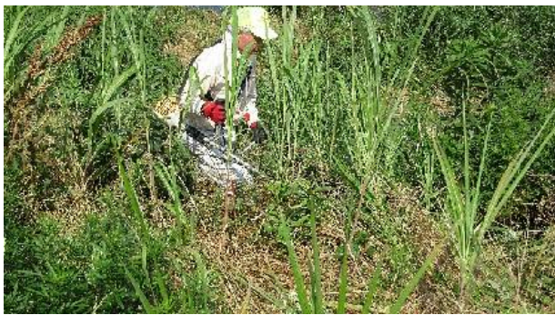
写真⑧：幟旗の回収 初公開です