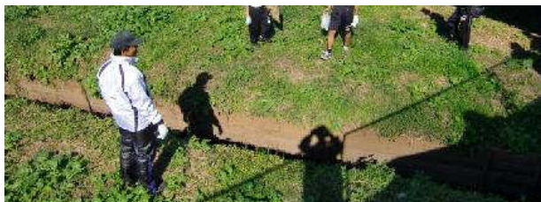
写真⑦：小出川（４）東中付近