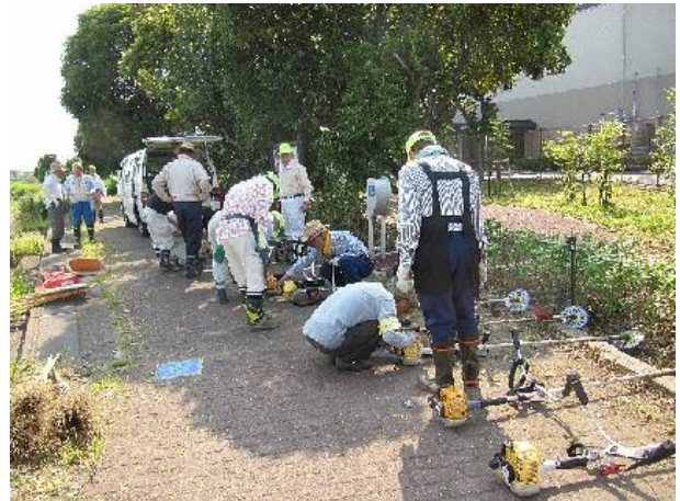
写真①：刈払い機準備中

今回はリサイクルセンター前のあずまや（屋根付き）で休憩ができました。快適でしたよ。