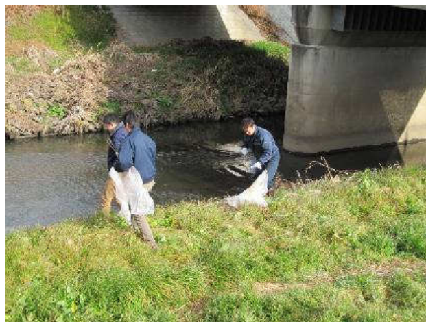
写真②：ゴミ拾い中1 旭橋付近