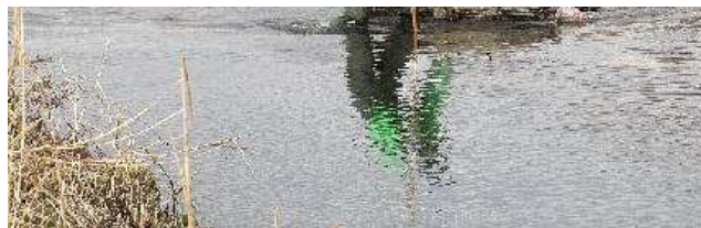
写真⑧：ゴミ拾い中 寒川橋上流左岸