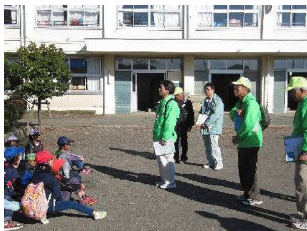
写真②：エコネットメンバー挨拶（1）