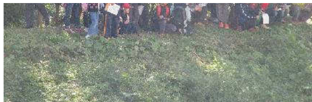
写真⑧：2班（その2） どんな鳥の声が聞こえましたか？