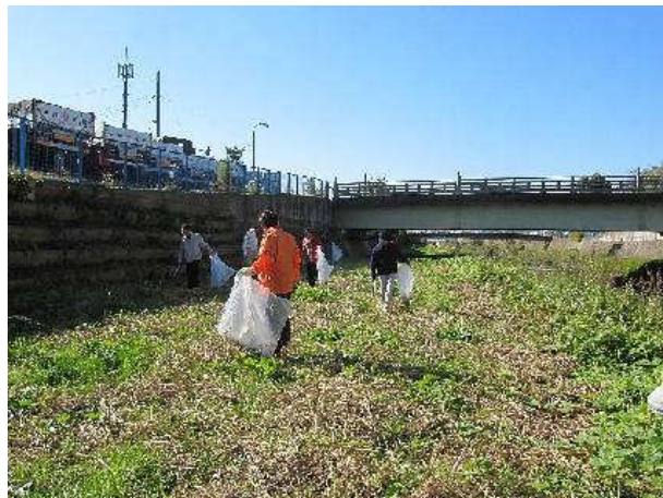
写真②：目久尻川（2）宮山大橋