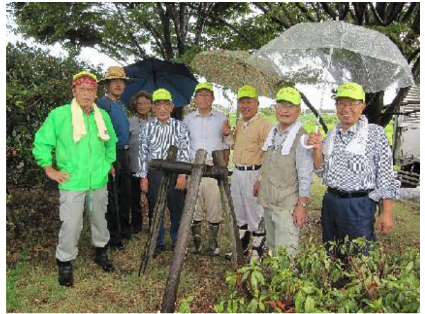
写真①：雨に降られて雨宿り 上合橋小公園