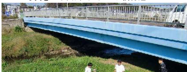
写真⑤：小出川（2）一ツ橋付近