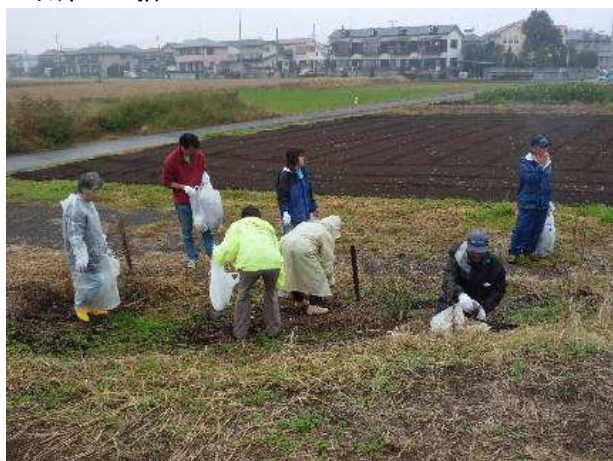
写真③：目久尻川（３）リサイクルセンター前 右岸ゴミ拾い