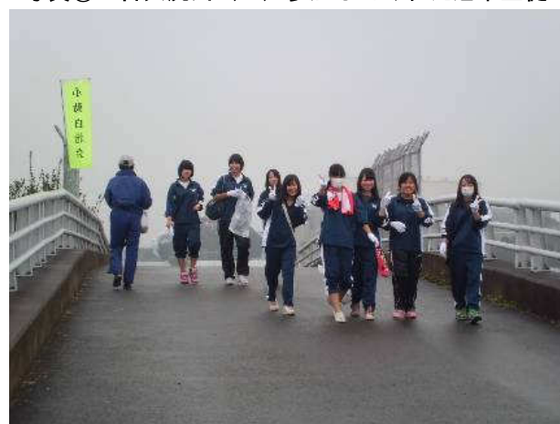
写真②：目久尻川（２）参加してくれた旭中生徒