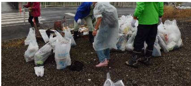
写真⑦：小出川（２）参加してくれた東中生徒