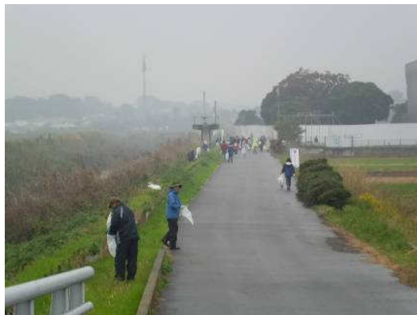
写真④：目久尻川（４）旭橋上流左岸ゴミ拾い