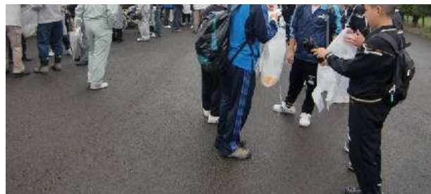
写真⑧：小出川（３）寺尾橋上手の町道