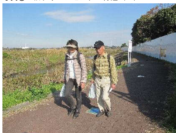
写真④：旧クリーンセンター付近（2）