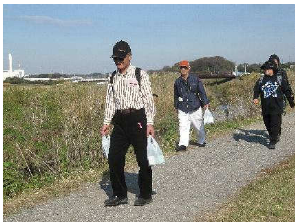
写真③：旧クリーンセンター付近（1）