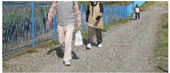
写真⑧：寒川神社ゴール受付の様子（１）お疲れ様でした。