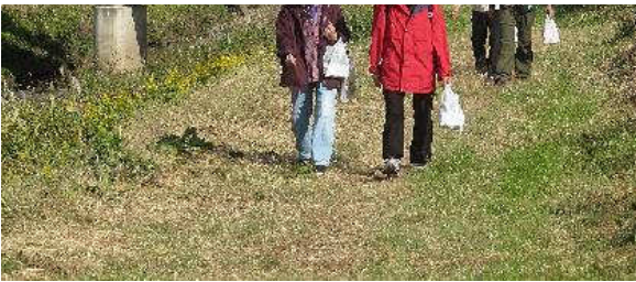
写真⑦：最後のゴールメンバ。今年も参加して頂きありがとうございます。