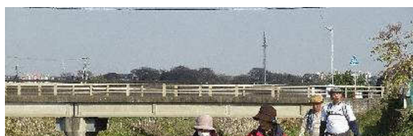
写真⑤：旭橋下流。 事前に土手の草刈を実施しました。