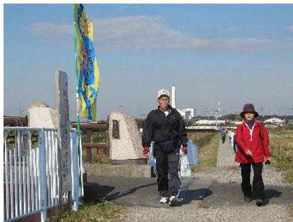
写真②：久保田橋にて（2）