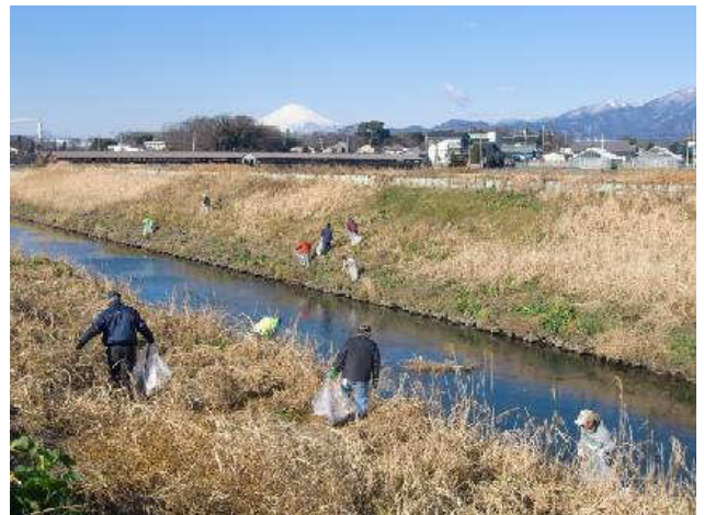
写真②：旭橋から下流両岸のゴミ拾い