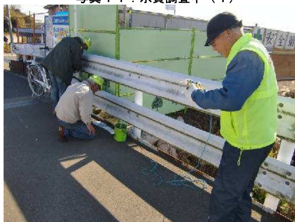
写真 11 : 水質調査中 (1)