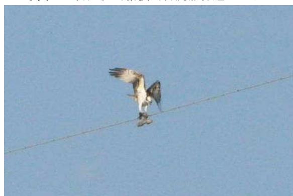
写真 8 : 目久尻川相模川合流点付近のミサゴ