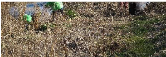
写真⑦川から引き揚げたビニール等