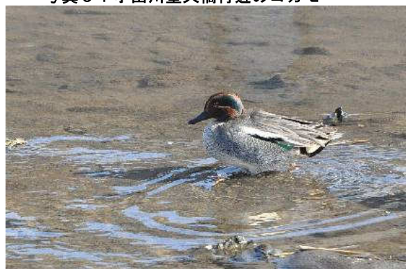
写真 9 : 小出川聖天橋付近のコガモ