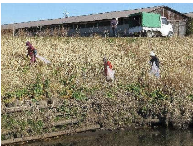
写真③：旭橋下流右岸のゴミ拾い（1）