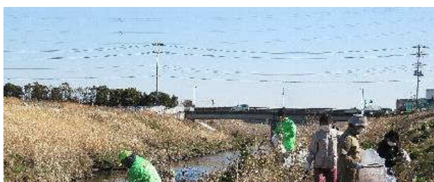
写真⑤：旭橋下流左岸のゴミ拾い