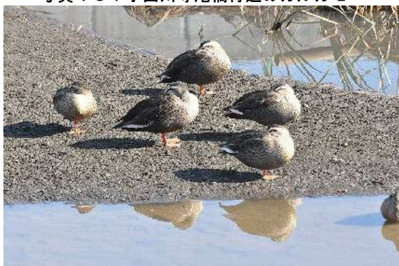
写真 10 : 小出川寺尾橋付近のカルガモ