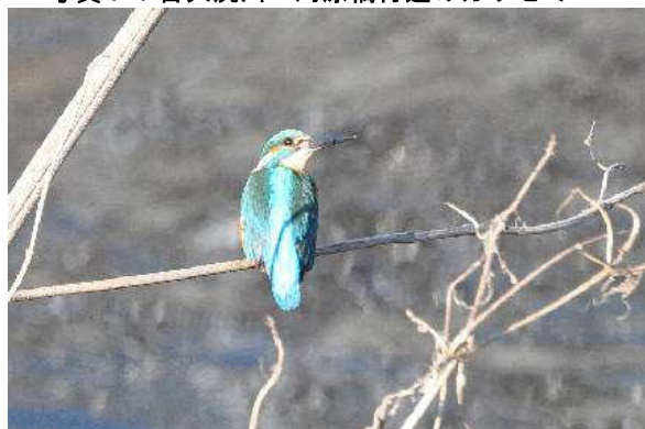
写真 7 : 目久尻川 河原橋付近のカワセミ