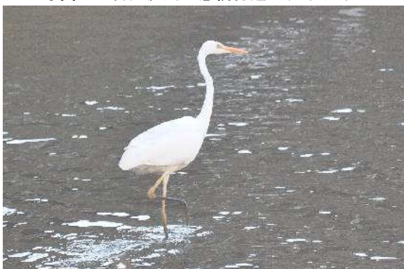
写真5：目久尻川 鵜橋付近のダイサギ