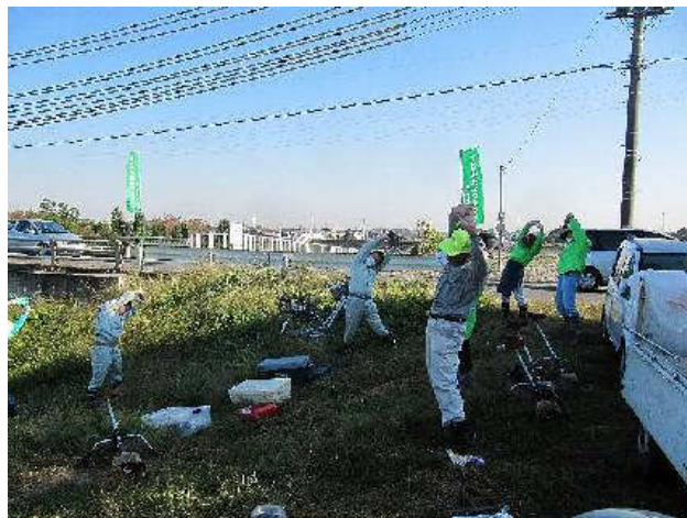
写真①：準備体操（旭橋下流左岸）