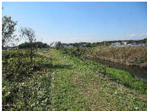
写真⑤：草刈後 旭橋-上合橋間左岸