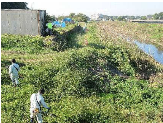
写真②：草刈中 旭橋下流左岸