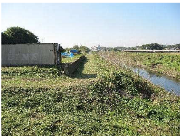
写真④：草刈後 旭橋下流左岸 きれいになりました。