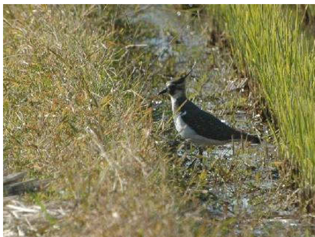
写真①：寒川高校付近（12月8日観察）