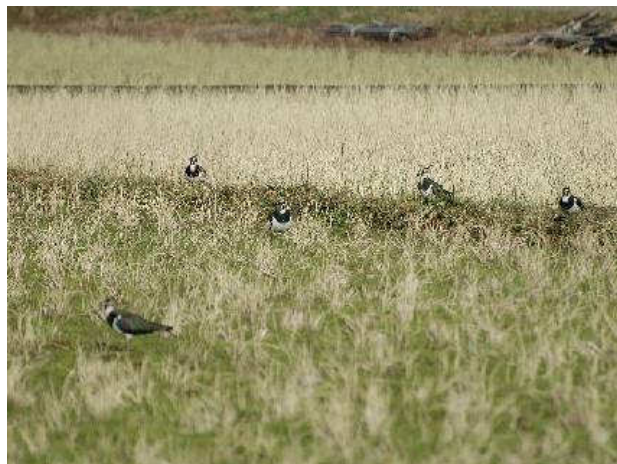
写真③：大昭橋付近2（12月20日観察）